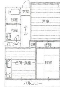
2DK (和室) 居室面積 約58㎡