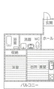
1DK 居室面積 約47㎡