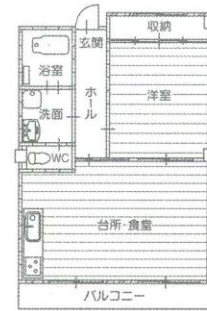
1LDK 居室面積 約58㎡