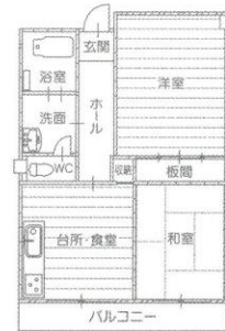
2DK (和室) 居室面積 約58㎡