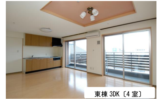
東棟 3DK [4 室]