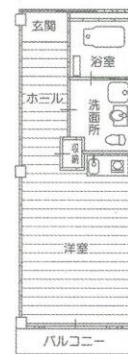
1R-A 居室面積 約31㎡