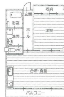
1LDK 居室面積 約58㎡