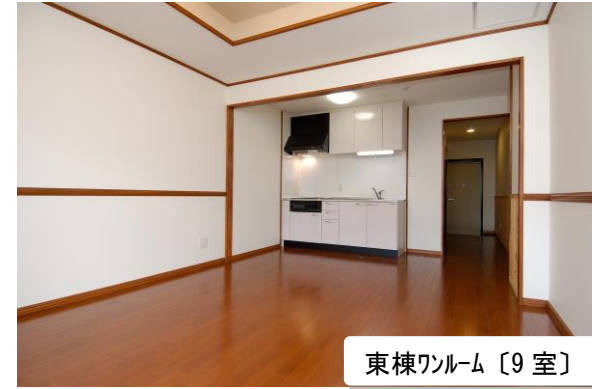
東棟ワンルーム [9 室]