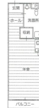
1R-B (浴室なし) 居室面積 約29㎡