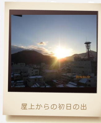
屋上からの初日の出