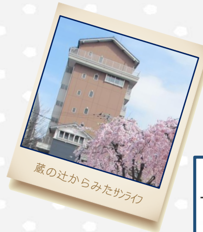
蔵の辻からみたサライフ