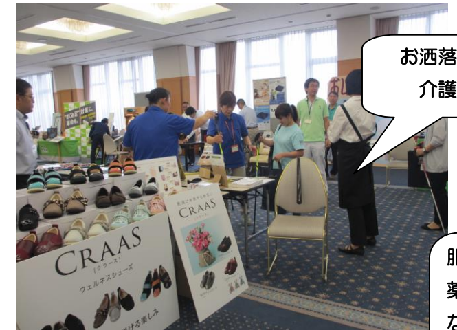
お洒落な介護用靴!