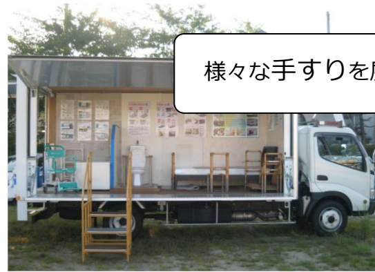
様々な手すりを展示