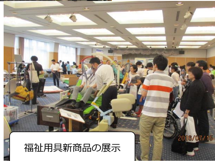
福祉用具新商品の展示