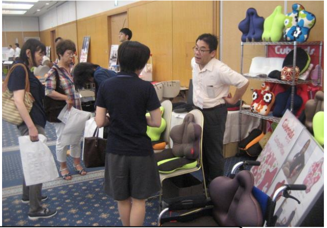
大人気商品！CuCu クッション！