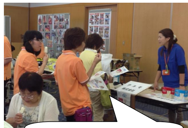
水分&栄養補給 アイス