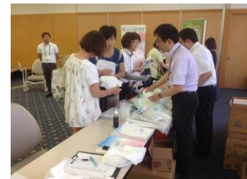
紙おむつのサンプルもたくさんご用意させていただきました。