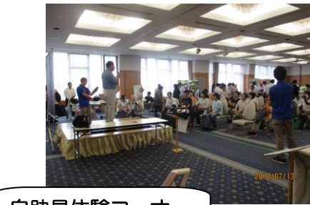
自助具体験コーナー