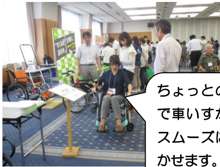
ちょっとの力で車いすが、スムーズに動かせます。