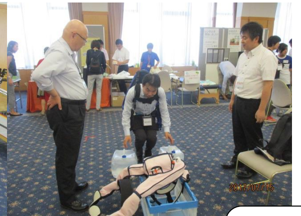
マッスルスーツを 装着しての 体験中！