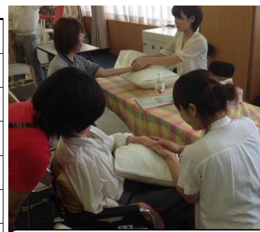
アロマハンドマッサージ