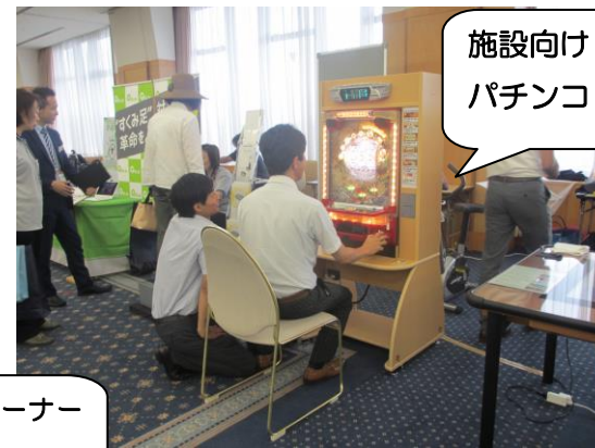
施設向けパチンコ