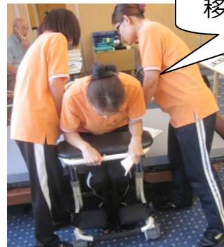
移乗介護ロボット！