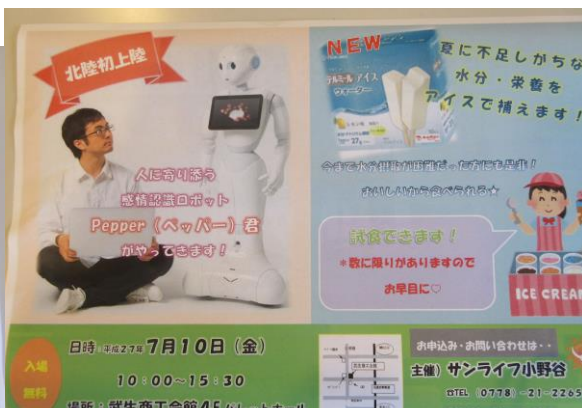
「ペッパーくん」北陸初！