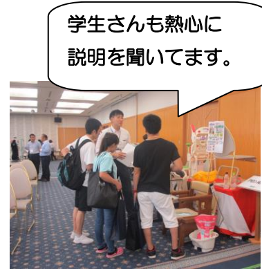
学生さんも熱心に説明を聞いてます。