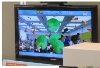
脳トレ (認知症予防)