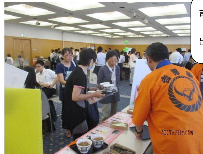
吉野家牛丼の介護食 出ました！！