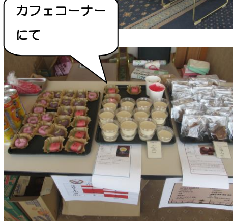
カフェコーナーにて